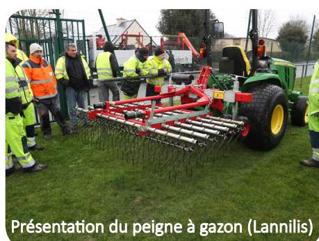
Présentation du peigne à gazon (Lannilis)